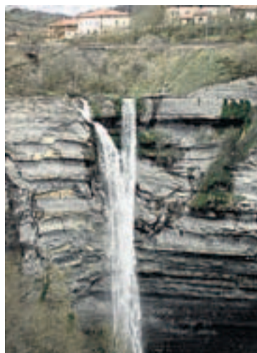
Cascada de Goiuri-Gujuli.

En Álava hay espacio para el Toloño, el Tologorri y la Virgen de Oro; en Gipuzkoa destacan Aizkorri, Txindoki y Aralar; y en Navarra, La Mesa de los Tres Reyes, las Bardenas, la Foz de Lumbier e Irati, entre otros muchas posibilidades.