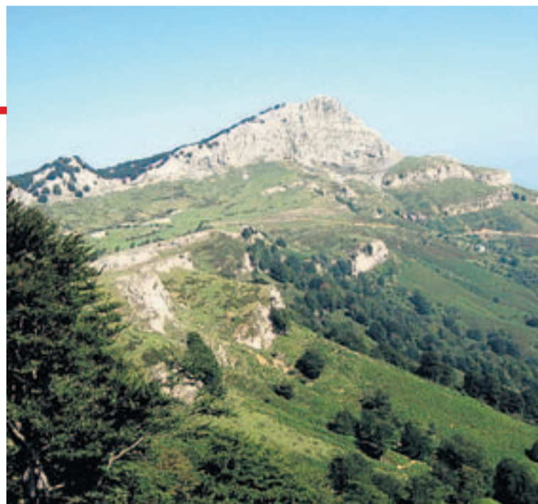
Vista que se puede apreciar desde las estribaciones del Gorbea.